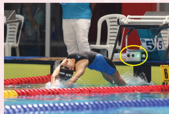
国際大会のスタートランプ(例)

赤「スタート台に乗る」 ⇒黄「Take your marks」 ⇒緑「スタート」